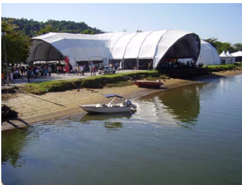
Tenda dos Autores

fará um livro de memórias, ditará para alguém as suas lembranças”. Ah, o “rei” não quer concorrência... Está entendido então.